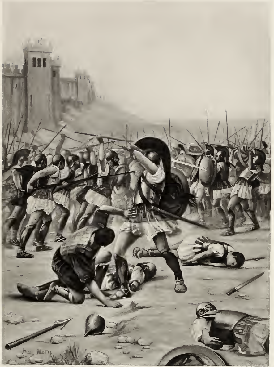
H. MOTTE INV.